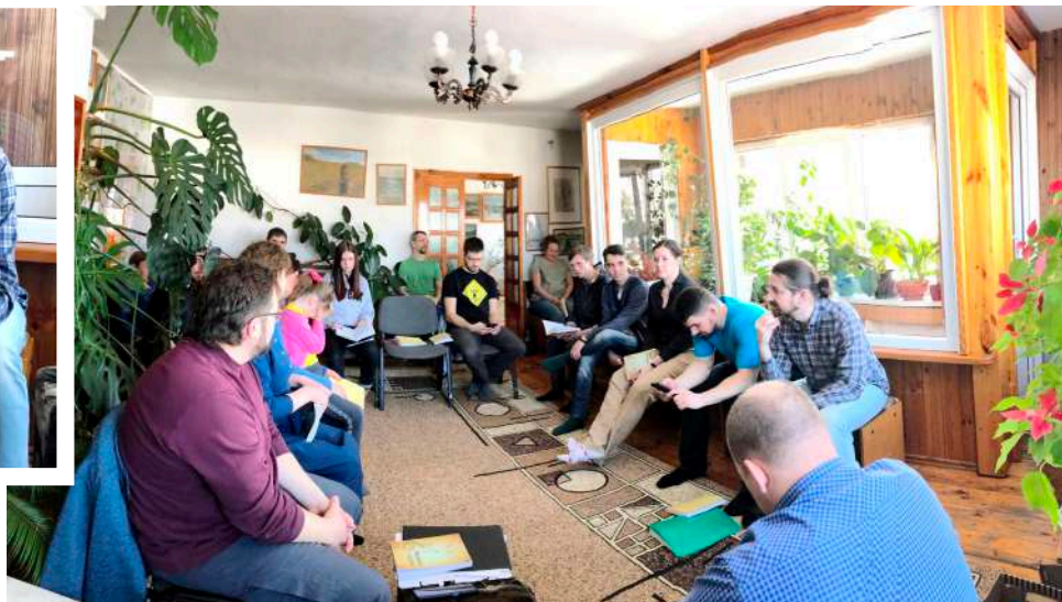
Воскресное Богослужение вместе с Бийской Церковью Христа

Жаль только, что слишком короткая встреча. Нельзя в обычный день обойти каждого, обнять, сказать: «Эээ... браток... Чей-то ты приуныл? Мы еще здесь, в вере стоим, и ты стой. А Христос придет... Обязательно придет!» Нельзя, но можно после таких собраний легко повторить слова Павла: «Духом я с вами». Потому что это так и есть. Истина.