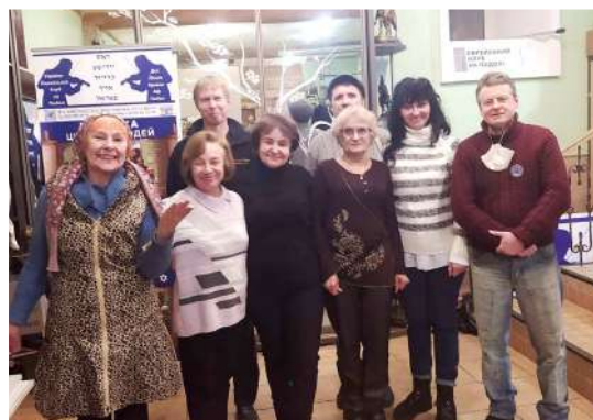
Члены нашей Общины на твор- ческой встрече