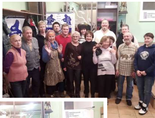
Члены Клуба разгово- рочного цветита для начи- нающих