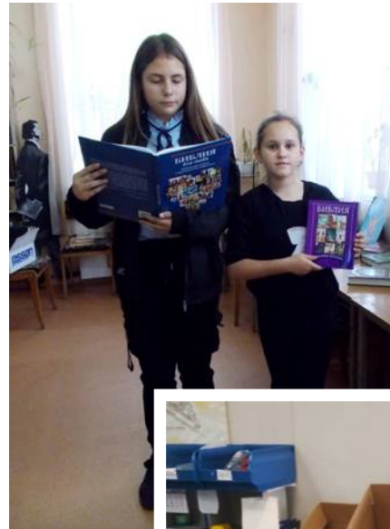
Фотографию прислали из одной из библиотек, куда мы высылали Библии