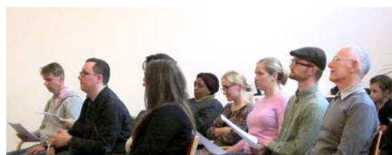
Семинар в Кельне «Псалтырь – книга Священного Писания»