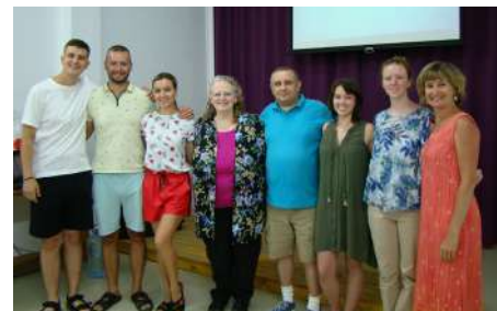
Учителя песенного мастер-класса