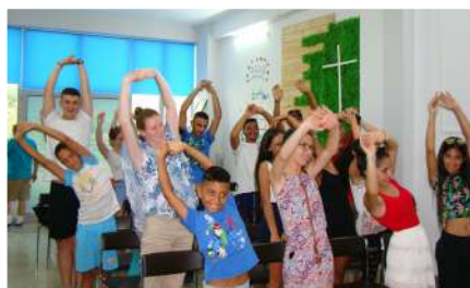
Разминка перед пением