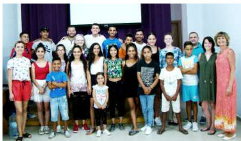
Участники песенного занятия