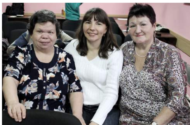
Глухие участницы семинара из барнаульской общины с сурдопереводчиком

Много нового, интересного и полезного было услышано, но мало времени оказалось, чтобы все это «переварить», обдумать, обсудить «в кулуарах». Семинар еще не успел закончиться, а уже речь шла о том, чтобы сделать еще один, два, три семинара для обсуждения таких важных вопросов, как благодарение, детское поклонение в церковном собрании, совместное поклонение