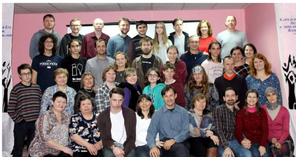
Участники семинара – около 50 человек из городов Сибири и Урала

20-22 октября в г. Барнауле прошел семинар «Приступая ко граду Бога живого. Поклонение Богу от начала времен и во веки веков». Этот семинар был во многом особенный. В начале 2000-х в Барнауле ежегодно проводился Сибирский Христианский семинар, на который для назидания и общения съезжались христиане не только из сибирских городов, но и из европейской части России. И вот, после многолетнего перерыва, в Барнаул собрались братья и сестры из Бийска, Томска, Новосибирска и Челябинска.