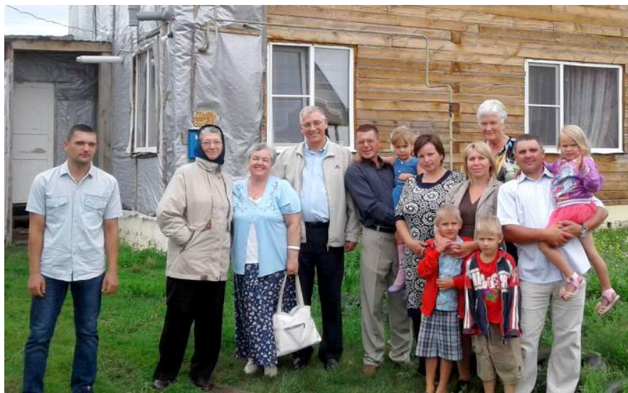
Церковь в селе Черемное