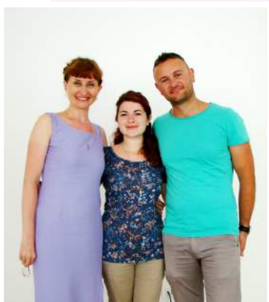
С Олти и Сояной