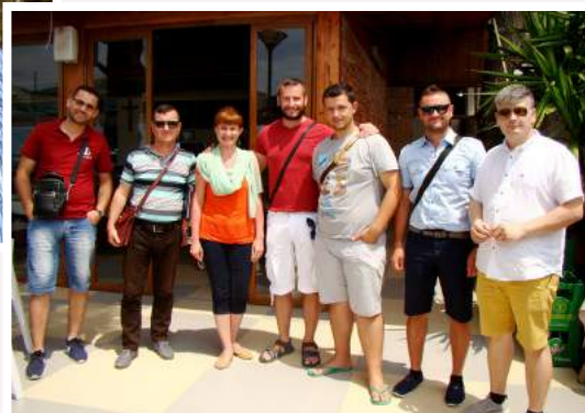
Встреча с братьями