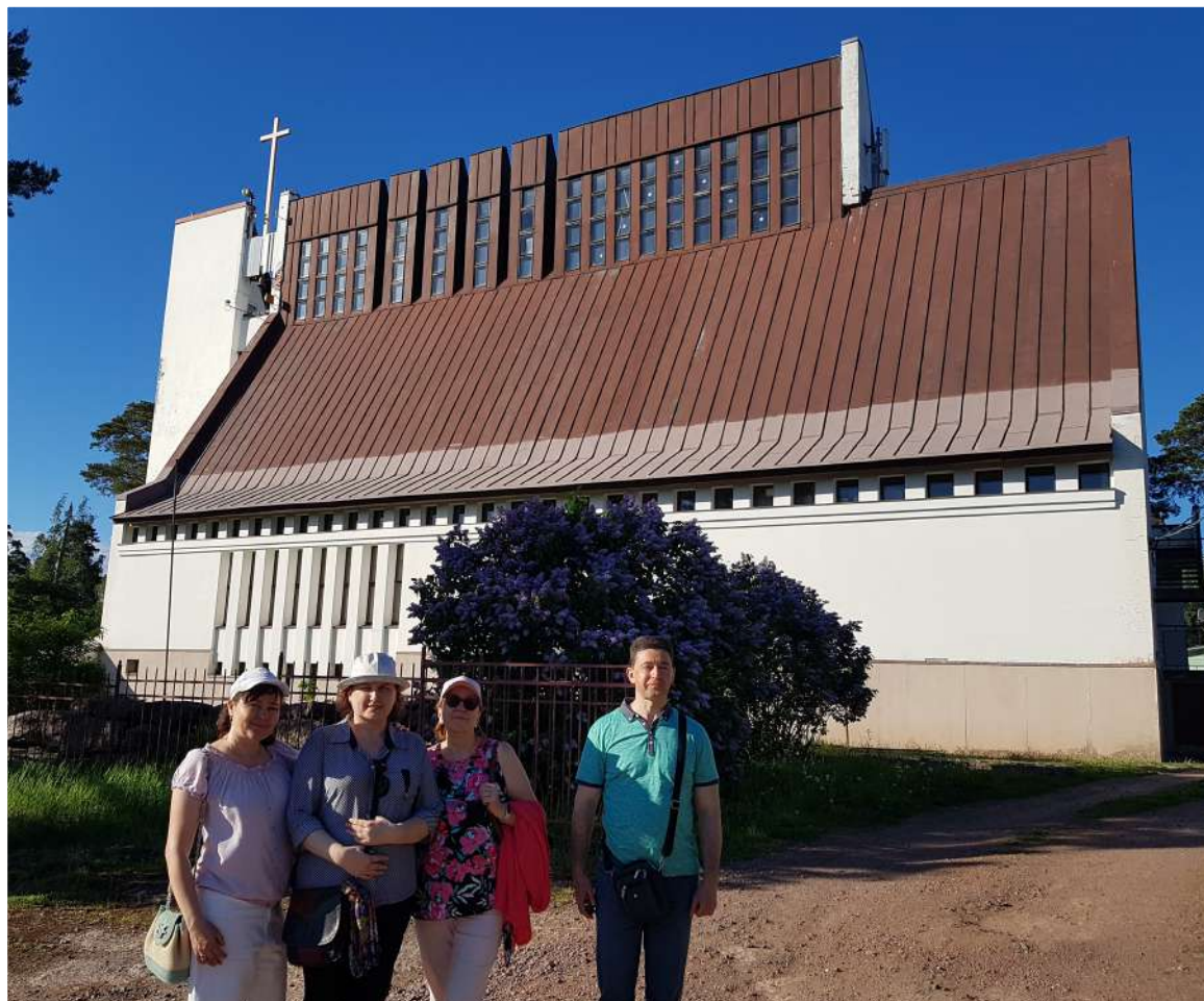
Церковь в Выборге «Дом на скале»